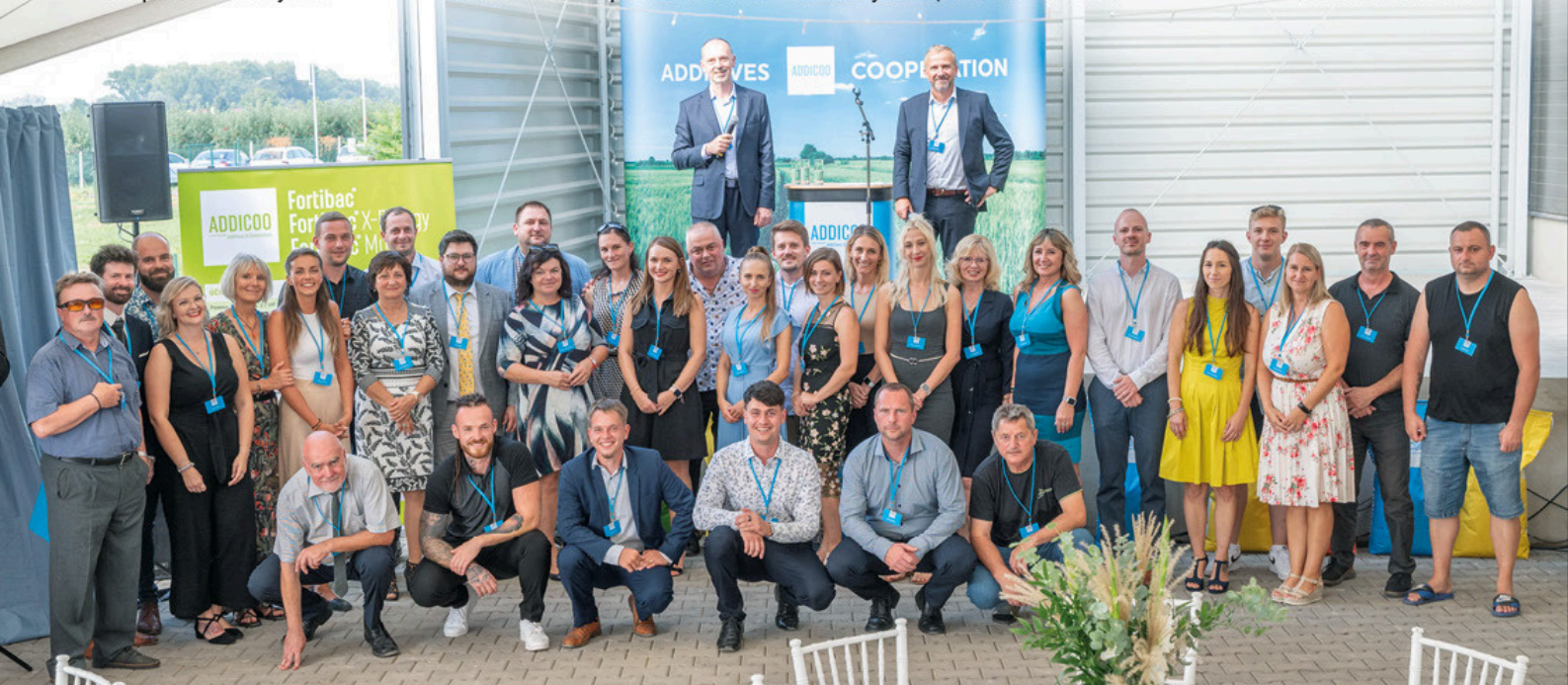
Tým pracovníků Addicoo