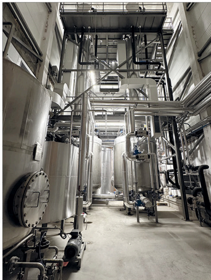
Specializovaná linka na výrobu esterů